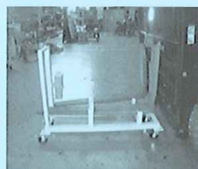
平成26年金賞作品 「フォーク脱着兼運搬台車」